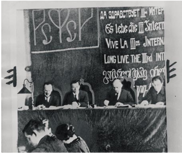
Lénine à la tribune du 1 er congrès de la III e Internationale (1919)

Archives nationales en collaboration avec la Maison des sciences de l'Homme de Dijon