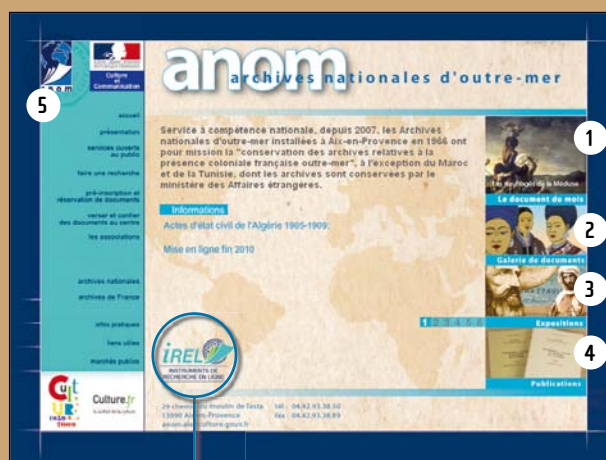
Irel : instruments de recherche en ligne

>> Au centre de la page d'accueil , un espace est réservé aux actualités et informations du centre d'archives et vous y trouverez notamment les annonces de mises en ligne de documents numérisés. À droite, plusieurs rubriques : 1 le document du mois présente un événement, un lieu ou un personnage de façon illustrée et documentée ; 2 la galerie de documents propose une sélection d'images ainsi que les documents du mois archivés ; 3 les expositions renvoient vers des expositions en ligne de très grande qualité et réalisées, pour tout ou en partie, par le centre d'archives ; 4 les publications présentent la librairie de guides, beaux-livres, cartes postales et CD-Roms. 5 Le bandeau de gauche est le menu principal du site et donne accès à une présentation du service d'archives et à des informations pratiques pour effectuer des recherches au centre. Aussi, si vous êtes particulièrement intéressé(e) par les recherches outre-mer, nous vous invitons à consulter régulièrement cette page d'accueil ■