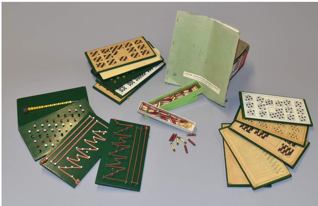
2016 052 012 Méthode d'apprentissage du tissage.